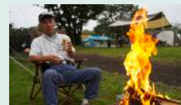
【名人直伝】 焚き火のコツ