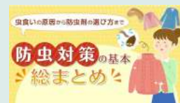
エステー様 「くらしにプラス」