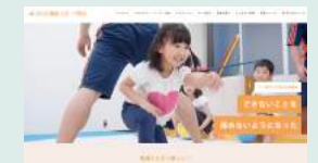
からだ機能 スポーツ教室HP