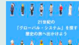
世界史ビジュアル ストーリー