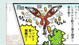
モーション漫画 「動脈硬化戦士」